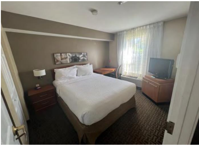
Phòng Ngủ Điển Hình