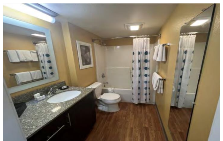
Phòng Tắm Điển Hình