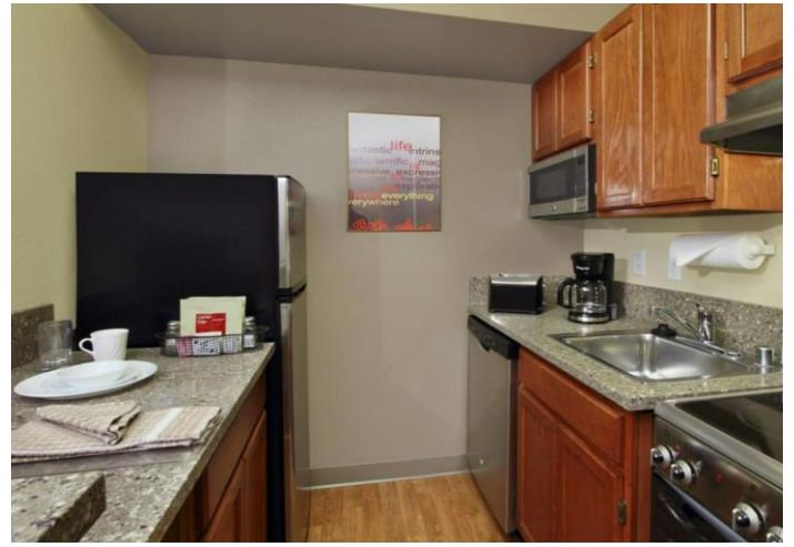
Phòng Bếp Điển Hình